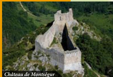
Château de Montségur